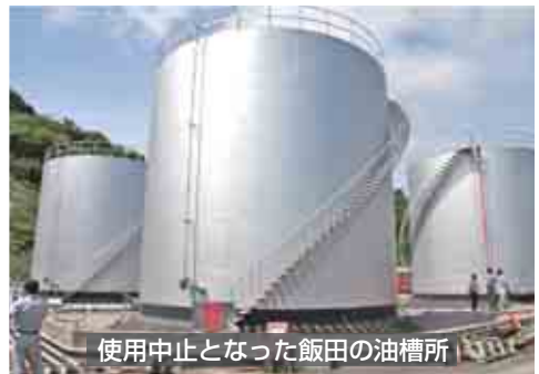
使用中止となった飯田の油槽所

町内で使用するガソリンなどを貯蔵している飯田の油槽所で、誤った種類の油が混入する事故が発生。給油した約1,000台の車両に、エンジンがかからなくなるなどの被害が出ました。一時、油の安定供給ができなくなるなど、生活に大きな影響を及ぼしました。