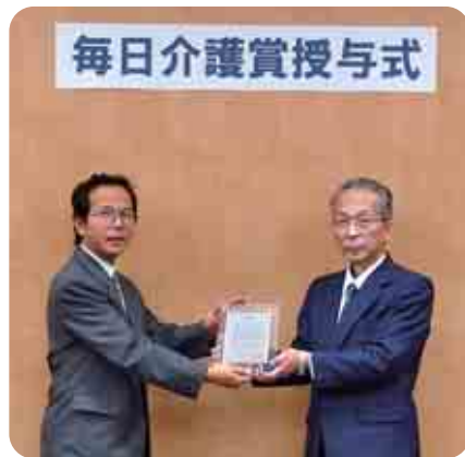
毎日介護賞授与式

会食や子どもたちとの交流活動など、精力的に活動をしているサロンです。野菜作りという共通の趣味を生かし、野菜出荷も行っています。町内の商店で「まにの里」の野菜をご覧になったこともあるのでは?