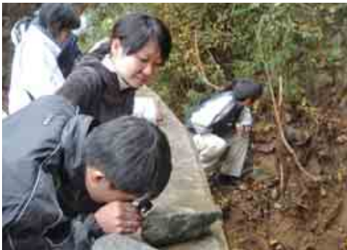
ルーペを使って岩石を見るととても面白いですよ！