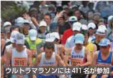
ウルトラマラソンには411名が参加