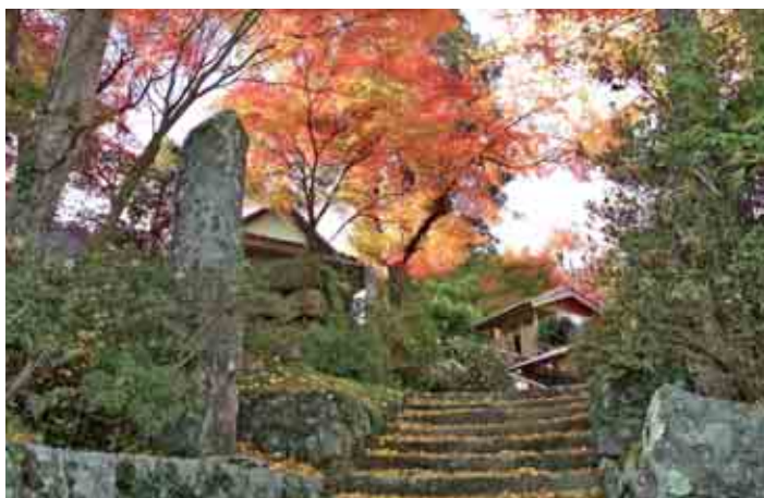
都万目地区のあごなし地藏紅葉（11月24日撮影）

秋の全国火災予防運動にあわせて、秋季火災予防運動消防パレードがサンテラス前駐車場で行われました。町立保育所幼年消防クラブによるアトラクションが行われ、会場に訪れた観覧者や保護者は防火への意識を新たにしました。その後、消防車両で町内を回る防火パレードが行われ、防火への意識啓発が図られました。同日夜には五箇地区伝統の消防団防火宣伝パレードも行われました。