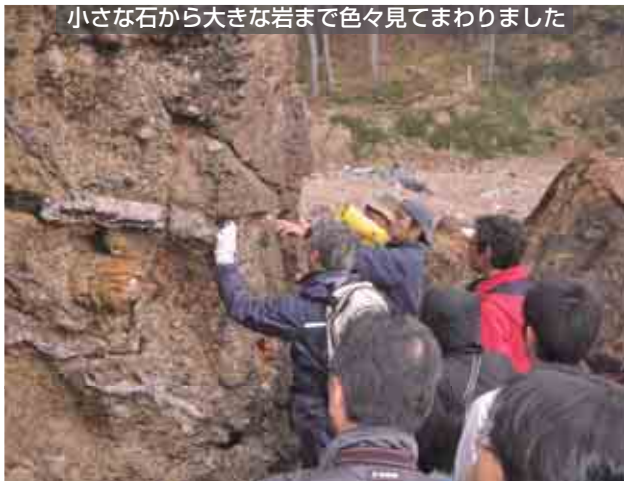
小さな石から大きな岩まで色々見てまわりました

年月をかけ火山灰などが堆積したものであったりします。もっと身近なものに目を向け、隠岐の素晴らしさを再発見してほしいですね。