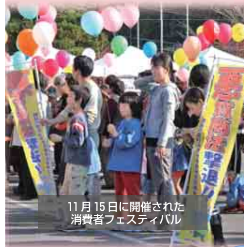
11月15日に開催された消費者フェスティバル

最近のテレビや新聞等で、連日のように耳にする「振り込め詐欺」。今年1月から9月までの全国の被害総額は、205億5900万円にも上り、これは過去最悪だった2004年の被害額を上回るペースとなっています。