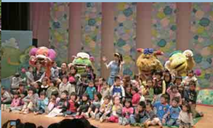
おかあさんといっしょ宅配便ぐーちょコランタン小劇場来島 島の子どもたちは大喜び（11月8日撮影）