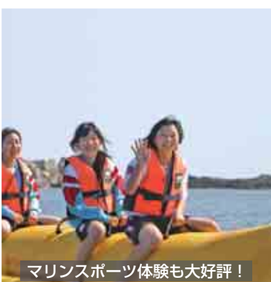
マリンスポーツ体験も大好評!

減少傾向にある観光客を呼び戻そうと、様々な取り組みがなされています。春から夏にかけては、関西方面からの修学旅行受け入れ事業が行われ、約1200人が来島、民泊やマリンスポーツ体験などを楽しみました。また、エコツーリズムを活用した観光のあり方についても様々な模索がなされています。